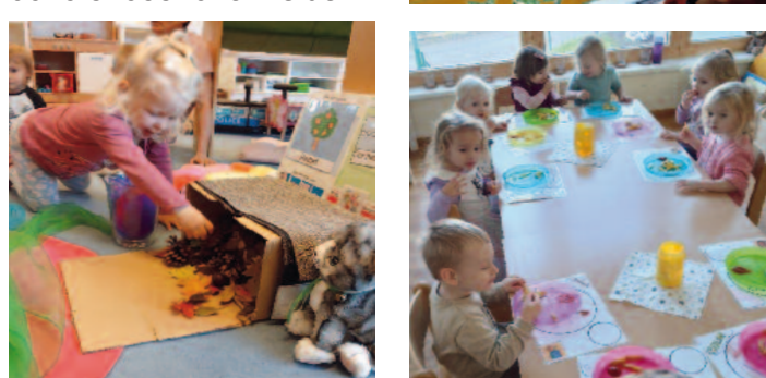
Impressionen aus dem Kinderkrippen-Alltag.