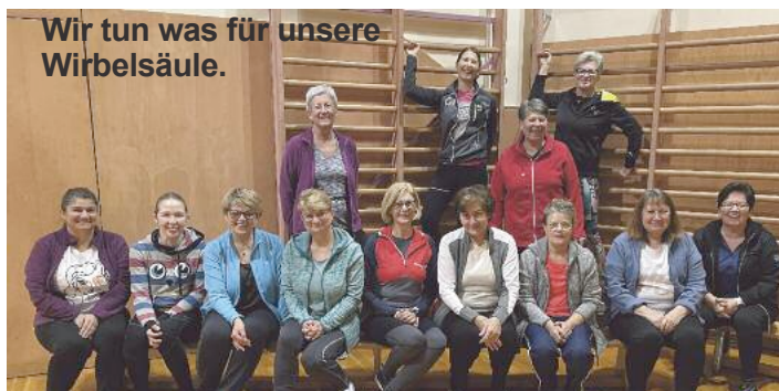
Wir tun was für unsere Wirbelsäule.