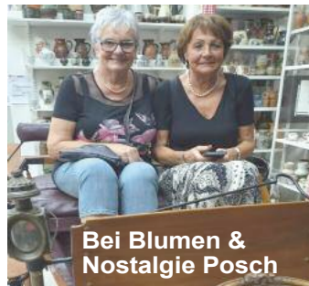
Bei Blumen & Nostalgie Posch

sche Pfarr- und Wallfahrtskirche Maria Pöllauberg steht am Sabbatberg, einem Ausläufer vom Masenberg, weithin sichtbar in der Gemeinde Pöllauberg in der Steiermark. Die Pfarrkirche heilige Maria gehört zum Dekanat Hartberg in der Diözese Graz-Seckau. Die denkmalgeschützte Wallfahrtskirche bildet mit der Filialkirche Heilige Anna, dem Pfarrhof, dem talwärts verlaufenden Bildstockweg, dem Kalvarienberg