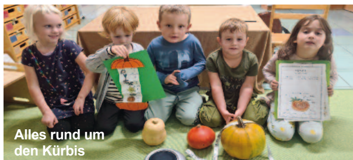
Alles rund um den Kürbis