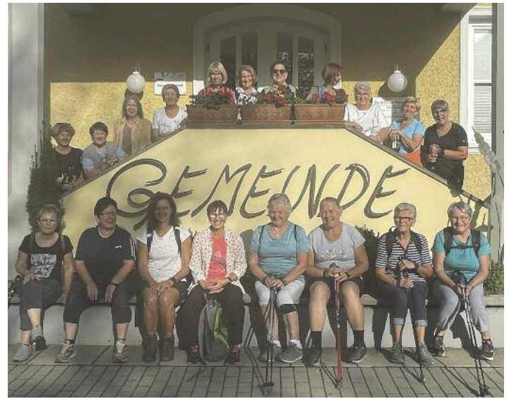
Oben und rechts: Die fleißigen Wanderinnen