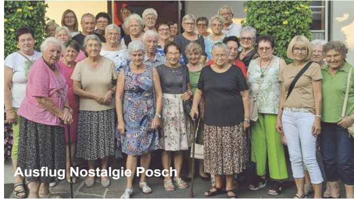
Ausflug Nostalgie Posch

Am 4. September ging der Ausflug zu Blumen und Nostalgie Posch. Die Nostalgiewelt Posch ist ein Museum mit etwa 20.000 ausgestellten Exponaten (u.a. Teddybären, Puppen, Krüge und Trinkgefäße, Modelle von Burgen und Schlössern bis hin zu Insekten und Schmetterlingen) und einer angeschlossene Gärtnerei (Blumen- und Nostalgiewelt Posch) sowie einem Café in Feldbach. Außerdem gibt es auf den 800 m 2 historische Automobile, Motorfahrzeuge und Fahrräder, den längsten Elektromotor der Welt, und vieles mehr zu sehen. Finanziert wird das Privatmuseum über Eintrittsgelder. Zum Abschluss führen wir zum Buschenschank Grabin. Am 19. Oktober durfte der Seniorenverein beim Kids Day Kekse verkaufen und dafür möchten wir uns recht herzlich bei der Freiwilligen Feuerwehr Heimschuh bedanken. Der letzte Ausflug im Jahr 2024 ging auf den Pöllauberg. Die römisch-katholi-