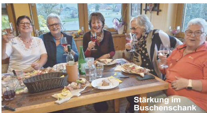
Stärkung im Buschenschank

Abschließend wünscht der Seniorenverein allen ein gesegnetes und frohes Weihnachtsfest.