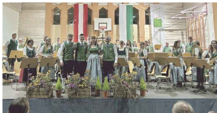
Beim Herbstkonzert in der Schutzengelhalle.

Jahreshauptversammlung 2. Februar 2025 im Musikheim mit Neuwahlen