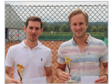
Links: Die erfolgreichen Tennis-Damen der 1. Allgemeinen Klasse. Oben: Die siegreichen Herren und unten die besten Damen beim Heimschuh Open.