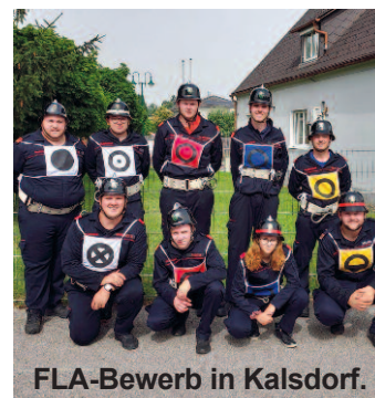
FLA-Bewerb in Kalsdorf.