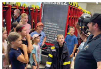
Besuch der Kinder.

Die Freiwillige Feuerwehr Heimschuh bedankt sich recht herzlich bei Ihren Kameradinnen und Kameraden für das ehrenamtliche Engagement und wünscht weiterhin Alles Gute für den Dienst in der Feuerwehr.