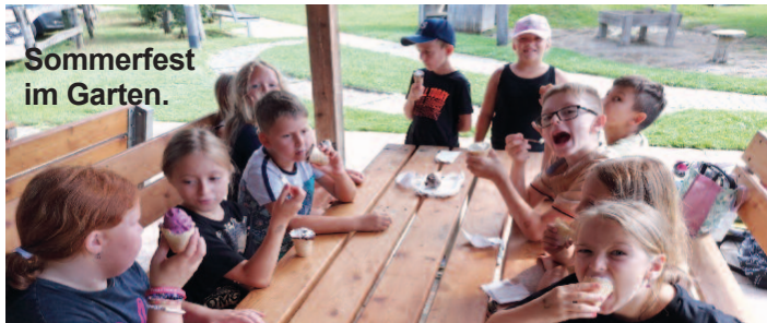
Sommerfest im Garten.

Kinder führten das Stück in der Schutzengelhalle auf. Danach gab es ein gemütliches Beisammensein im Garten des Kindergarten. Als Abschluss sangen die angehenden Schulkinder das „Schul anfängerlied“ und die angehenden Schulkinder erhielten jeweils eine