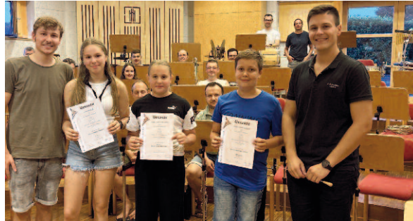
Einige der ausgezeichneten Jungmusiker.